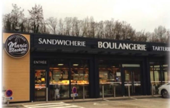
Boulangerie Mari Blachère