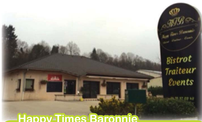
Happy Times Baronnie